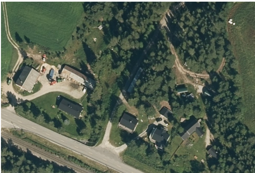
Fig. 1 Oversiktsbilde av eiendommene gnr/bnr 12/75, eid av Arne Solvang, og 12/36 og 223, eid av Anne Marie Engebretsen.