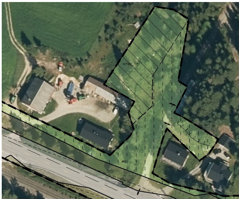
Fig. 3 Revidert plankart med redusert riggområde ved eiendommen gnr/bnr 12/223.