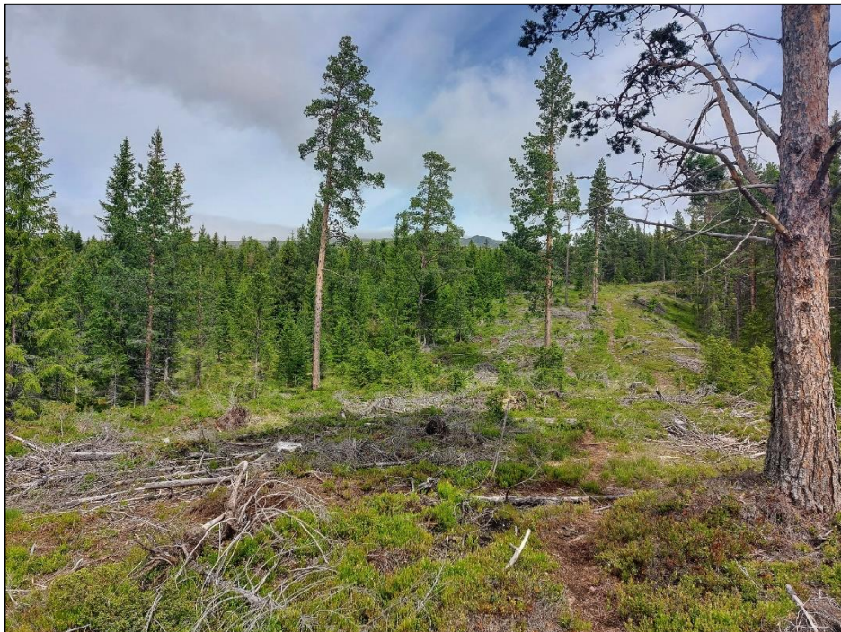
Detalj fra sørlig del av planområdet. Sett mot NØ.