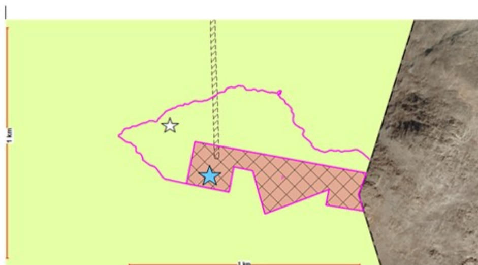
Fig. 1 Kartutsnitt over viser forslag til ny plangrense for Utkikkspunkt Trontoppen.

I gjeldende kommuneplan for Alvdal er deler av planområdet avsatt til byggeformål, med underteksten radar- og televirksomhet. Arealet er unntatt fra rettsvirkning i kommuneplanen, da reguleringsplanen for Trontoppen fortsatt er gjeldende for området.