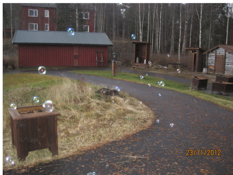
Sansehagen på Solsida er flittig brukt